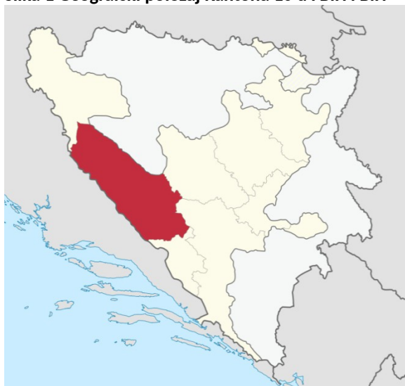
Slika 1 Geografski položaj Kantona 10 u FBiH i BiH